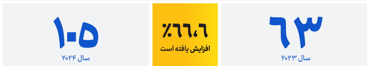
مقایسه آمار در شش ماه نخست سال ۲۰۲۳ و ۲۰۲۴

در تاریخ ۲۸ جنوری ۲۰۲۴ در ولسوالی «واغظ» ولایت غزنی در اثر انفجار یک سرگلوله هاوان یک کودک کشته و پنج تن دیگر زخمی شدند. بر اساس معلومات بدست آمده یک کودک می‌خواست این سرگلوله را به خانه‌اش منتقل کند که منفجر شد و در نتیجه شش تن کشته و زخمی شدند.