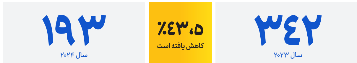
مقایسه آمار قتل‌های هدفمند، مرموز و فرا قضایی در شش ماه نخست سال ۲۰۲۳ و ۲۰۲۴

این کاهش ممکن است به دلیل محدودیت‌های شدید بردسترسی به اطلاعات از سوی طالبان باشد.